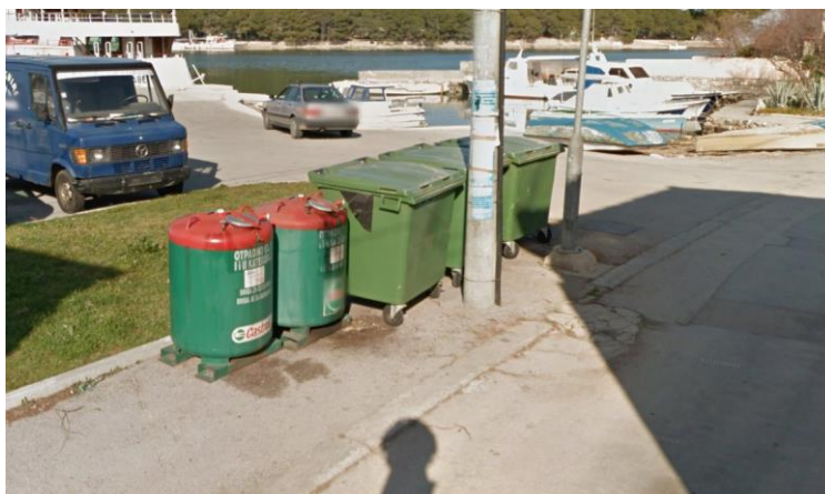
Slika 2-2. Spremnici na javnoj površini u Kukljici

Prikupljanje otpada sa zelenih otoka obavlja tvrtka Čistoća d.o.o. Zadar, a prikupljeni otpad odlaže na lokaciju Diklo.