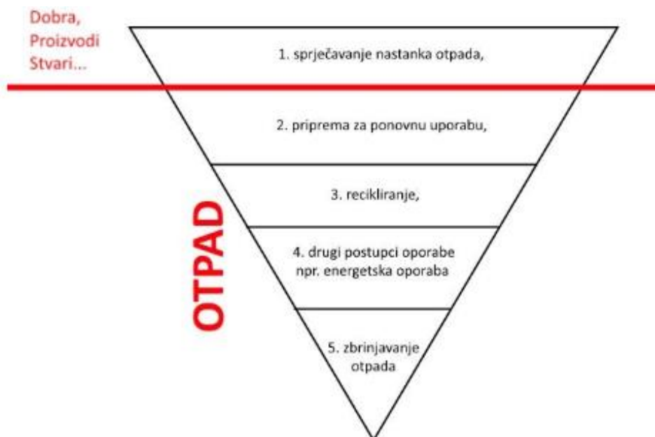
Slika 6-1. Red prvenstva gospodarenja otpadom