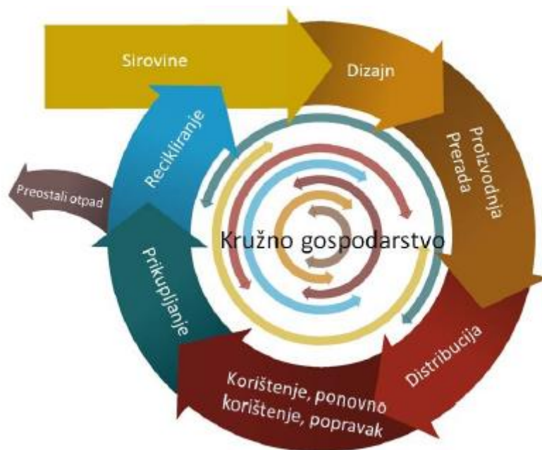
Slika 6-2. Model kružnog gospodarstva

Za prelazak na kružno gospodarstvo potrebne su promjene u cijelom lancu vrijednosti, od učinkovitog upravljanja resursima, dizajna proizvoda, novih poslovnih i tržišnih modela, novih načina pretvaranja otpada u resurse do novih modela ponašanja potrošača.